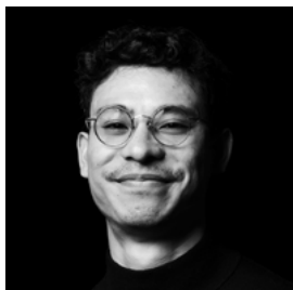
Yannick Verweij Scenografie, kostuum- en lichtontwerp